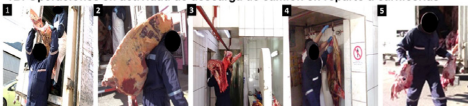
Figura 1: Operaciones de manejo manual en actividad de carga y descarga de cuartos de vacunos.

Por otra parte, las cajas con vísceras que pesan 60 kg, son transportadas en equipo por ambos trabajadores, mientras que las cabezas las transportan ambos, pero de manera individual (Figura 1B-5).