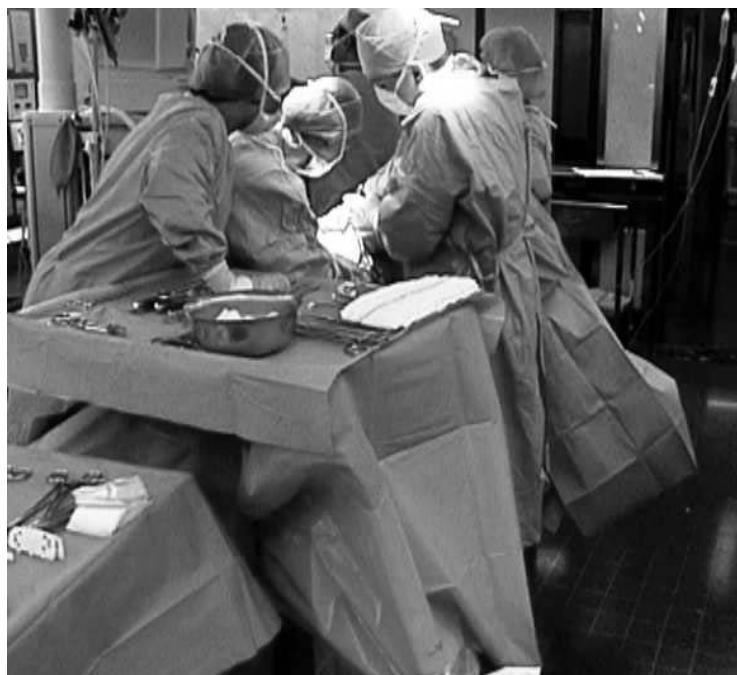
Figura 4. Postura de los trabajadores. La postura es forzada: instrumentista con flexión, rotación y lateroflexión del tronco.