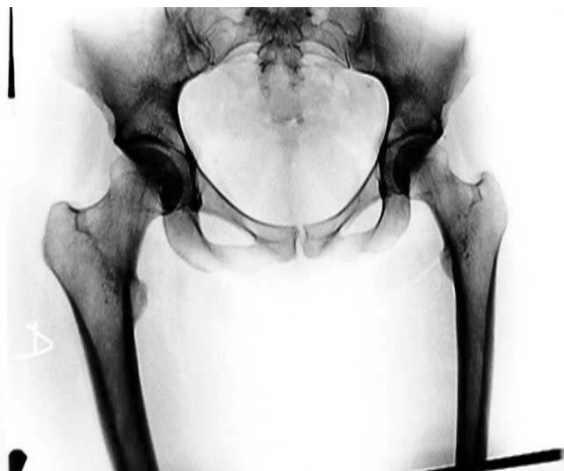
Figura 2. Radiografía de la osteítis dinámica de pubis. Se observa un deflecamiento de la sínfisis del pubis y un aumento de la densidad de la cortical de las ramas ascendente y descendente del pubis.