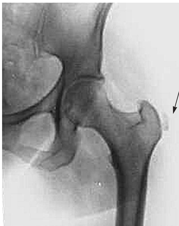
Figura 1. Imágenes radiográficas en positivo de la peritrocantéritis. La imagen marcada con una flecha corresponde a la calcificación peritrocantérea.

Se describen 2 casos de trocanteritis (cuadro clínico de dolor, impotencia funcional e imagen radiológica de calcificación peritrocantérea) (fig. 1) y un caso de osteopa-