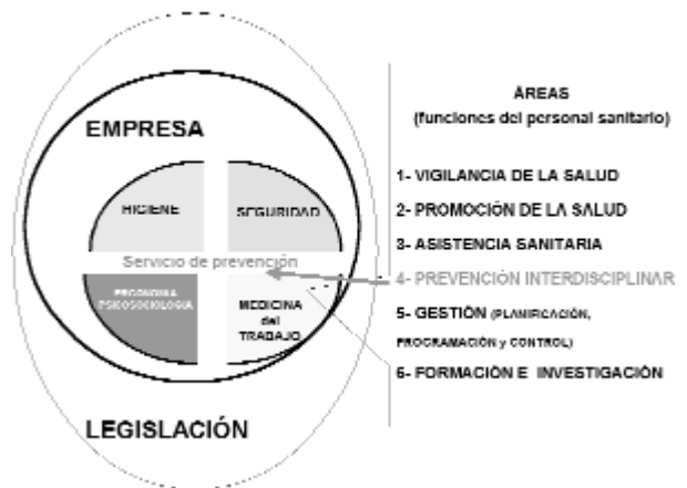
Figura 1. Áreas funcionales de la medicina del Trabajo en los Servicios de Prevención.

Prevençió es diferencien en sis àrees, tal com es mostra a la Figura 1, que agrupen tant les actuacions pròpiament o estrictament sanitàries com les que els sanitaris realitzen conjuntament i de forma coordinada amb els altres professionals dels Serveis de Prevenció i/o de les empreses. Tots